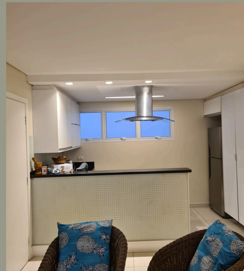
Pisos e revestimentos precisando ser substituídos