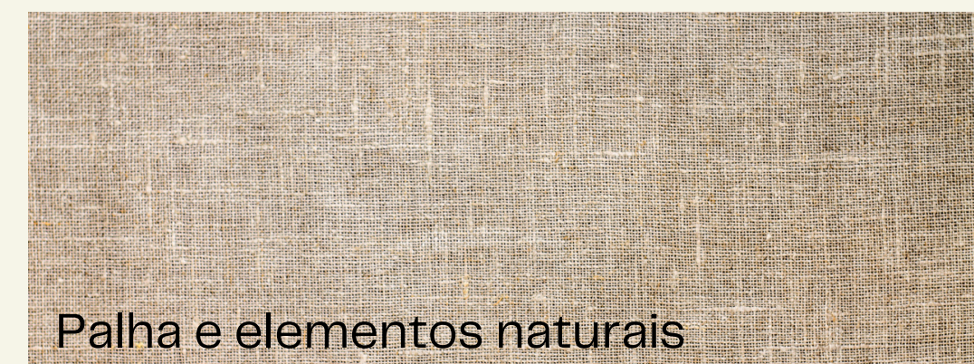
Palha e elementos naturais

Os painéis de MDF são o freijó natural e tons de cinza e branco para um constraste ideal.