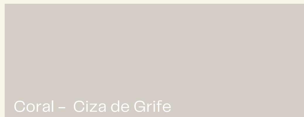
Coral - Ciza de Grife