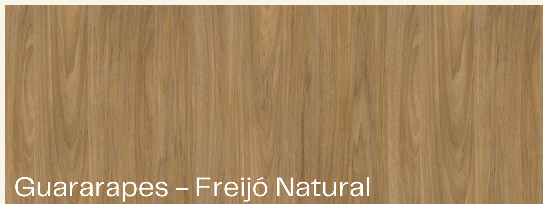
Guararapes - Freijó Natural