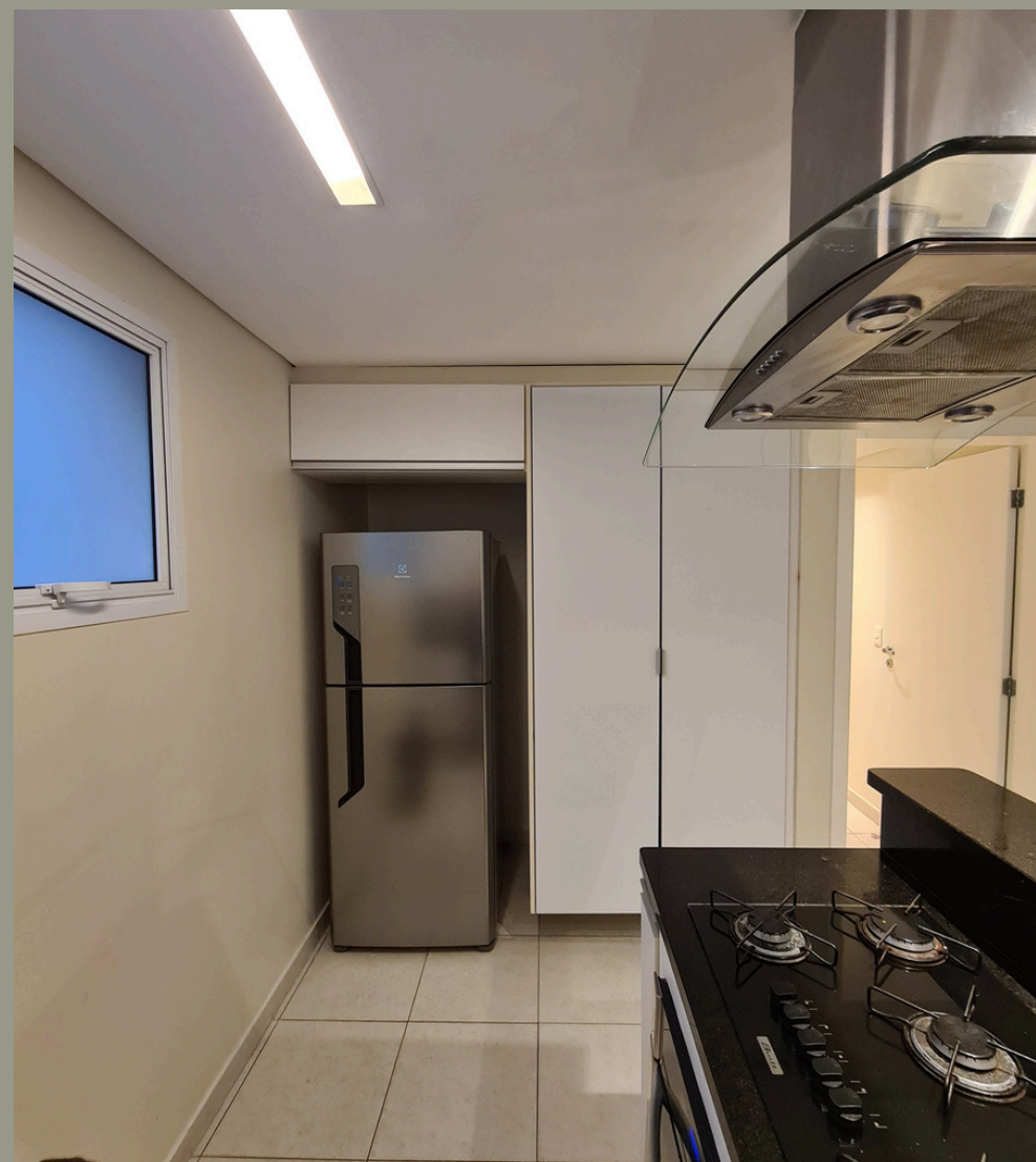
Moveis planejados desgastados